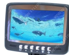
Fishcam plus 700