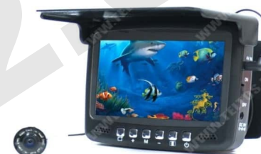
Fishcam plus 750