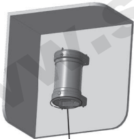
Защитная решётка вниз