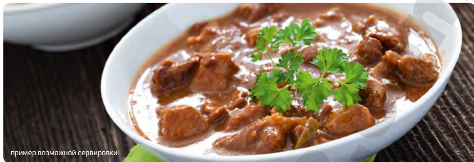
пример возможной сервировки