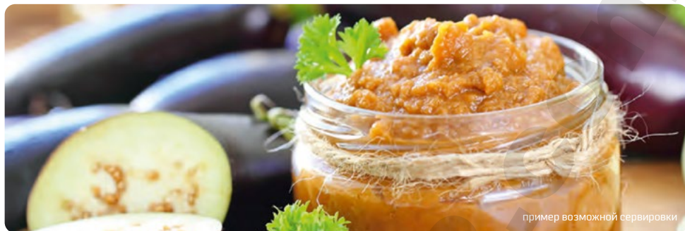
пример возможной сервировки