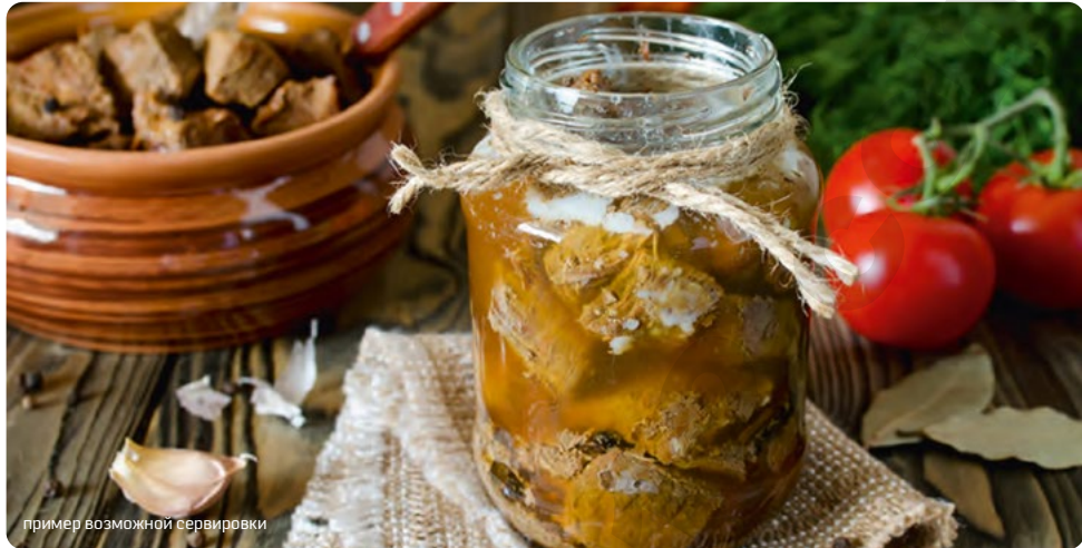
пример возможной сервировки