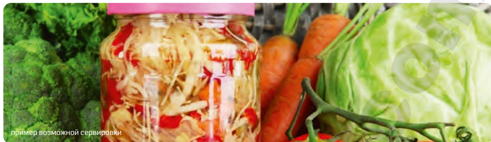
пример возможной сервировки